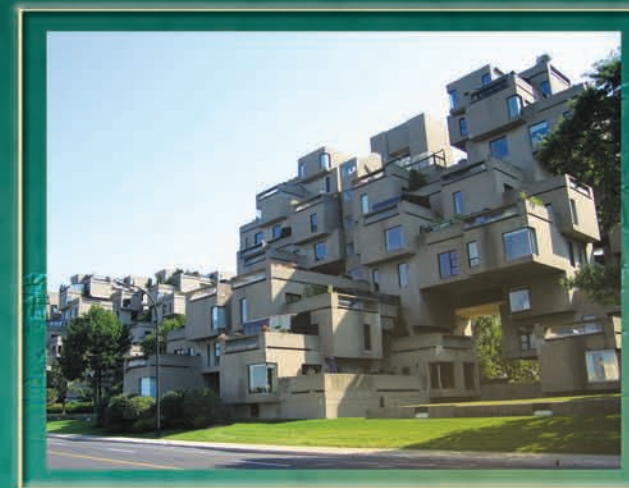
Design : Vallières Communication