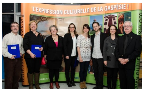
Prix Cultiv'art et Prix en Patrimoine, New Richmond, 2015.

À ce titre, les municipalités de la Gaspésie jouent un rôle de premier plan dans la vitalité, la diversité et l'accessibilité de l'offre culturelle, contribuant à une meilleure appropriation locale de la culture et de son développement. Notons que ce rôle croissant se manifeste par la multiplication des politiques culturelles municipales, des investissements dans certaines bibliothèques municipales (parfois en partenariat avec le milieu scolaire), dans l'implication des municipalités dans des événements culturels ou dans l'embauche de ressources dédiées aux loisirs ou aux services culturels ainsi qu'au développement de la culture. À titre d'exemple, on compte aujourd'hui sur le territoire gaspésien 7 politiques culturelles qui ont été adoptées ou mises à jour ces dernières années par des municipalités, des villes ou des MRC.