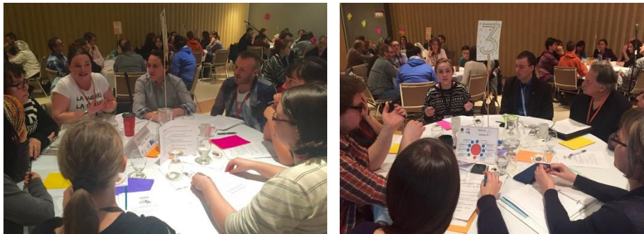
Forum de citoyenneté culturelle des jeunes, Bonaventure, 7 avril 2016.

Nous reconnaissons l'apport de toutes les générations dans le dynamisme culturel de la Gaspésie. Particulièrement par les jeunes, auprès de qui nous avons comme objectif de promouvoir la culture gaspésienne et leur apport à celle-ci. Nous avons d'ailleurs présenté un Forum sur la citoyenneté culturelle des jeunes, en avril 2016, à l'instar des autres Conseils de la culture du Québec.