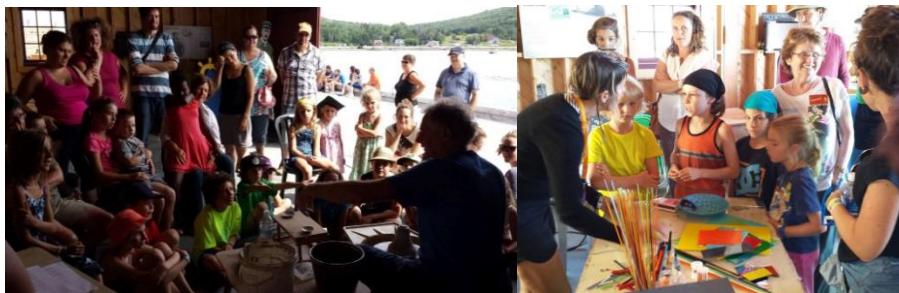
Allée des artisans, projet du Conseil de la culture, en partenariat avec le CMAQ et le Festival Musique du bout du monde, Gaspé, 2015.

La professionnalisation de nos artisans et artistes se développe depuis plusieurs années en Gaspésie. Certains d'entre eux sont devenus de véritables entrepreneurs, grâce notamment au développement et à l'accessibilité des technologies numériques, qui facilitent souvent le réseautage, la promotion, la commercialisation et le rayonnement de nos artistes et artisans en région. L'accessibilité accrue de ces technologies permet aussi l'essor de plusieurs entreprises privées de production vidéo ou de studios d'enregistrement. L'offre de formation continue a aussi été consolidée et s'est développée ces dernières années notamment par l'octroi au CCG d'un mandat et d'un budget dédiés à cette fin.