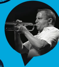
Jocelyn Couture, porte-parole et trompettiste jazz international, natif de Victoriaville