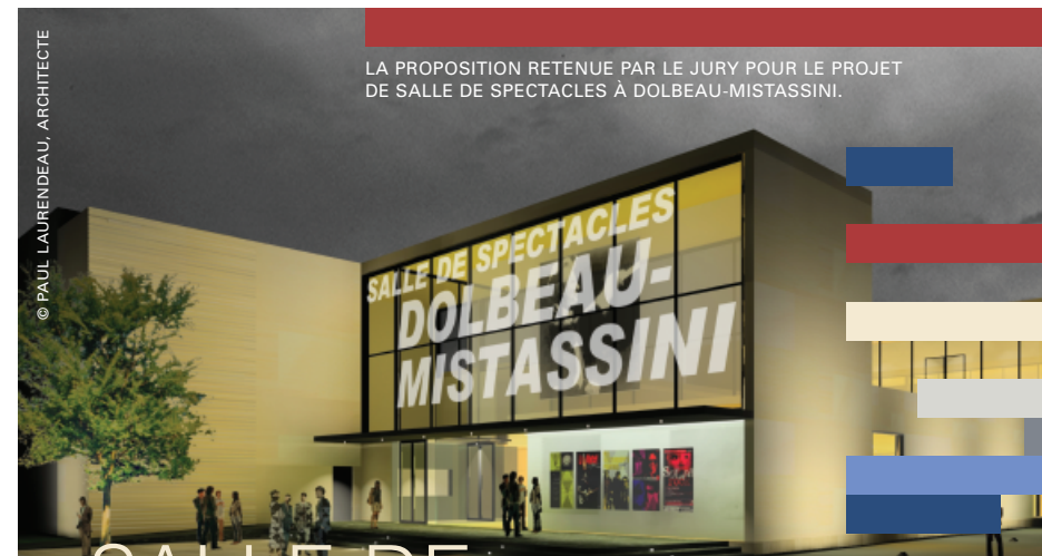
LA PROPOSITION RETENUE PAR LE JURY POUR LE PROJET DE SALLE DE SPECTACLES À DOLBEAU-MISTASSINI.

La lutte à l'exclusion culturelle est l'une des cibles importantes du Ministère. La notion d'accessibilité ne concerne pas uniquement le rehaussement de la fréquentation culturelle, mais vise davantage, de façon globale, la démocratisation de la culture ainsi que l'élargissement du bassin des participants à la vie culturelle. Cette préoccupation à l'égard des exclus ou des « non-publics » n'est donc pas motivée par une éventuelle hausse des revenus autonomes des organismes culturels, mais bien par une volonté d'inviter un plus grand nombre de personnes au banquet culturel.