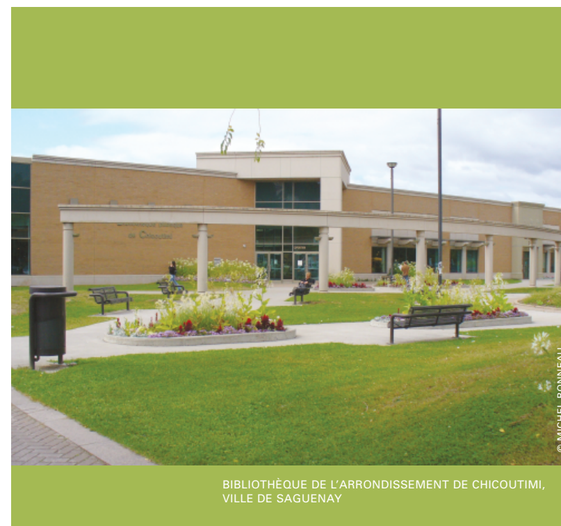
BIBLIOTHÈQUE DE L'ARRONDISSEMENT DE CHICOUTIMI, VILLE DE SAGUENAY

Le Service des loisirs de la Ville d'Alma (Auditorium d'Alma) a créé un événement de sensibilisation et de développement du public qui gagne chaque année en popularité. Les Mots dits veulent valoriser auprès du public le texte comme élément fondateur du spectacle, autant en théâtre qu'en chanson. Ils comportent un volet qui s'adresse au public scolaire et au grand public; ce volet s'applique particulièrement à joindre le public des jeunes adultes, souvent absent des salles de spectacles conventionnelles.