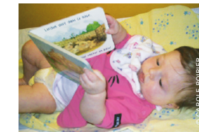
L'ÉVEIL À LA LECTURE COMMENCE AU BERCEAU...

Le Ministère a annoncé, le 16 février 2006, une aide financière de 50 000 $ dans le cadre d'une entente biennale avec la Conférence régionale des élus et le Centre régional de services aux bibliothèques publiques (CRSBP) du Saguenay-Lac-Saint-Jean.