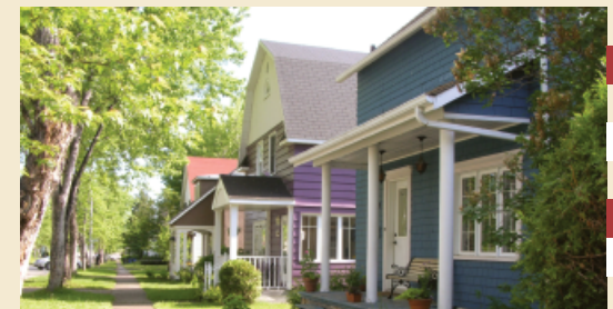
RANGÉE DE MAISONS DANS LE QUARTIER RIVERBEND, À ALMA.

La Ville d'Alma fournit des efforts soutenus afin de redorer son image. Des interventions sont prévues afin d'améliorer le cadre urbain et de revitaliser le centre-ville. La culture représente un élément majeur de cette stratégie et la conclusion d'une entente de développement sera assurément un atout non négligeable.