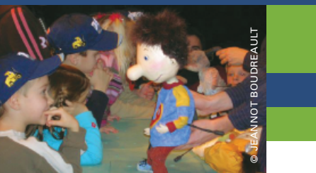
REPRÉSENTATION DEVANT LE JEUNE PUBLIC DE LA PIÈCE LA MALADIE FANTASTIQUE DONNÉE PAR LE THÉÂTRE LES AMIS DE CHIFFON.

Au Saguenay-Lac-Saint-Jean, 22 216 élèves des écoles publiques et privées ont participé à des activités culturelles grâce au soutien financier de 100 322$ alloué dans le cadre du programme La culture à l'école géré conjointement par le ministère de la Culture et des Communications et le ministère de l'Éducation, du Loisir et du Sport.