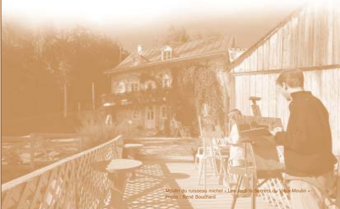
Moulin du ruisseau michel « Les Jardins Secrets du Vieux-Moulin »

Ce sont les différents métiers de création, artisanale ou purement artistique, reliés à la transformation du bois, du cuir, des métaux, des silicates ou de toute autre matière.