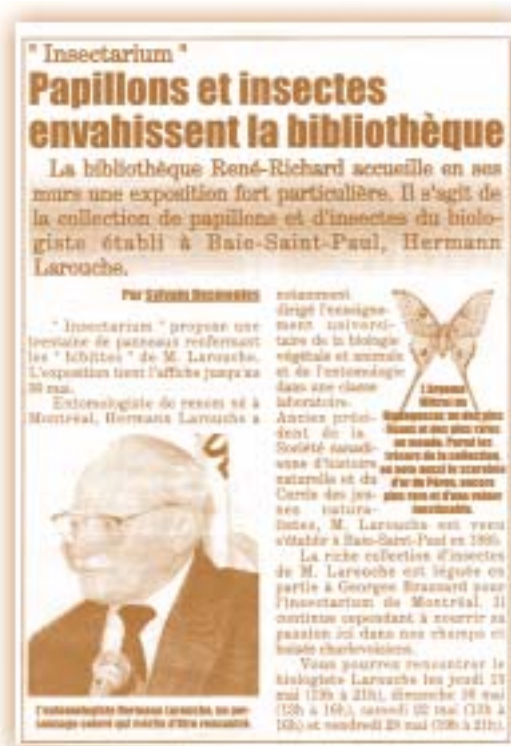
Le 8 mai 1999 - Journal l'Hebdo Charlevoisien

La municipalité qui entend affirmer son positionnement comme lieu de création et de diffusion de l'art au Québec, s'investira dans la promotion de la vie culturelle sur son territoire et suscitera une coopération exemplaire avec et entre les partenaires culturels et médiatiques.