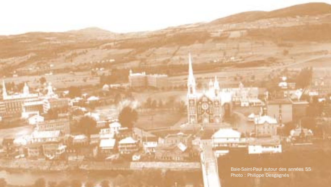
Baie-Saint-Paul autour des années 55

De plus, afin de guider la ville et la collectivité dans leurs choix et la définition de leurs priorités, cinq champs d'action précisent la portée des différentes orientations.