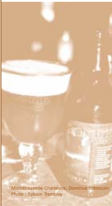
MicroBrasserie Charlevoix, Dominus Vobiscum

Cette orientation suggère la mise sur pied d'une structure organisationnelle municipale, condition préalable à la mise en œuvre de la politique, qui assurera une coordination entre les partenaires et devra solidariser les différents intervenants culturels.