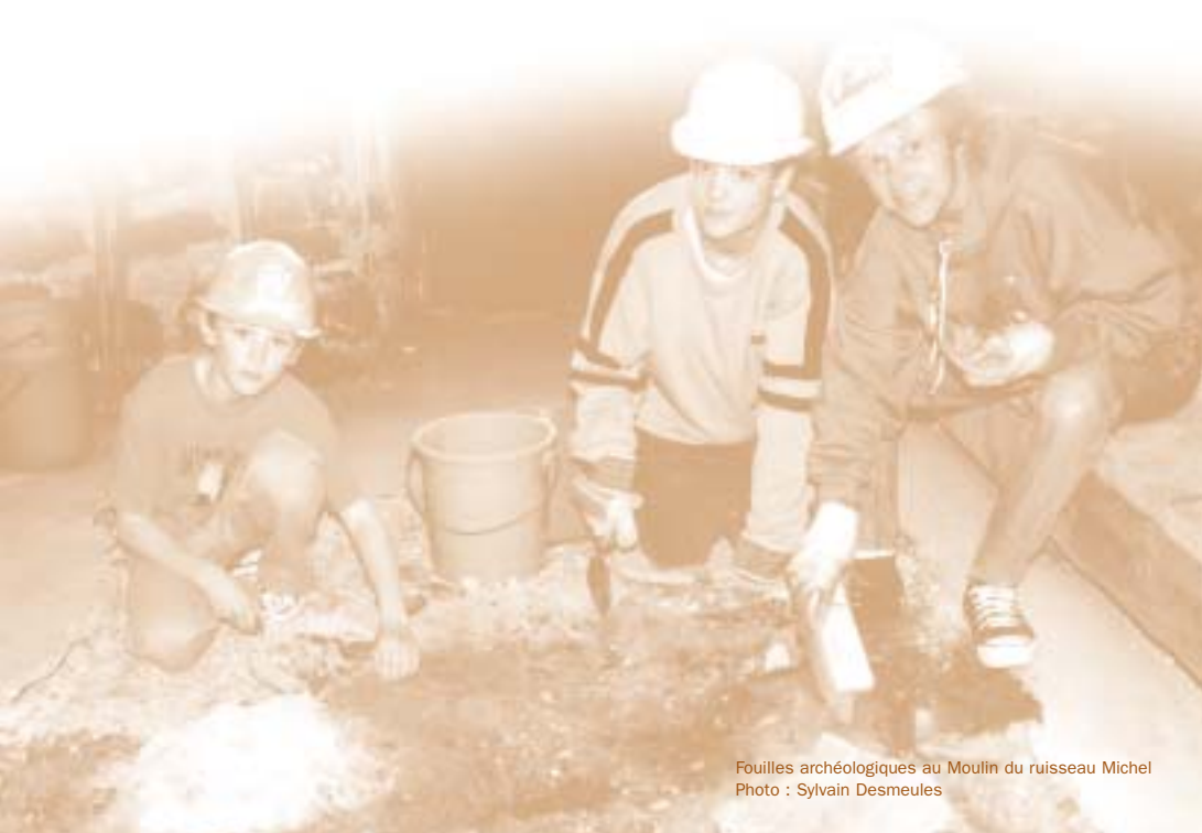
Fouilles archéologiques au Moulin du ruisseau Michel

Cette orientation suggère essentiellement que la ville établisse un pont entre les intervenants du domaine culturel et la population locale. Elle propose le développement de produits culturels et artistiques qui, tout en étant des attraits touristiques, s'inscrivent dans une perspective d'éveil et de satisfaction des besoins et des attentes culturelles des citoyens.