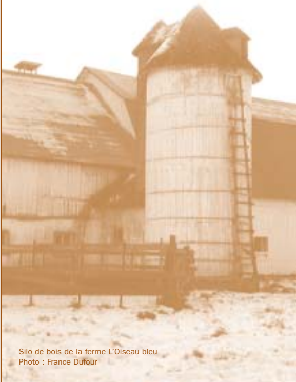
Silo de bois de la ferme L'Oiseau bleu

Étant donné la volonté d'améliorer la qualité de vie de tous ses citoyens, Baie-Saint-Paul reconnaît qu'il est important de consolider cette force et de favoriser le développement d'entreprises culturelles et de nouveaux projets créateurs d'emplois.