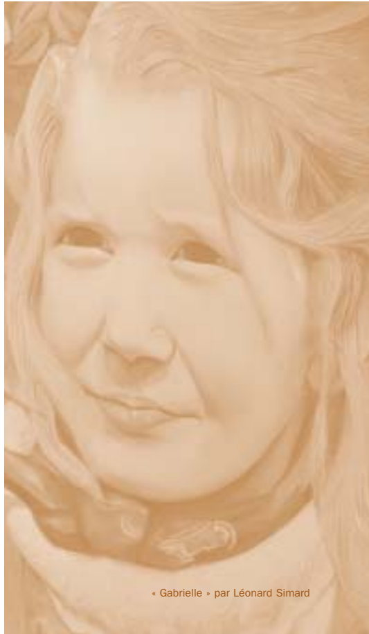
« Gabrielle » par Léonard Simard

La ville de Baie-Saint-Paul retient comme définitions pour les termes « artiste amateur » et « artiste professionnel » celles proposées par le ministère de la Culture et des Communications dans son « Guide d'élaboration et de mise en œuvre d'une politique culturelle municipale » :