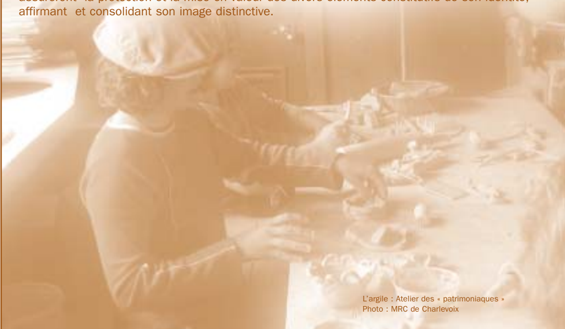
L'argile : Atelier des « patrimoniaques »

Par ce principe, l'action privilégiée par la ville s'inspire du passé et s'inscrit dans le présent pour construire l'avenir. De ce principe découle toutes les priorités et les actions qui assureront la protection et la mise en valeur des divers éléments constitutifs de son identité, affirmant et consolidant son image distinctive.