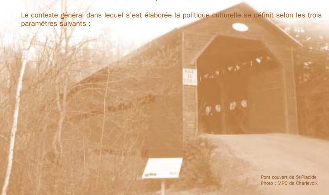
Pont couvert de St-Placide

Le contexte général dans lequel s'est élaborée la politique culturelle se définit selon les trois paramètres suivants :