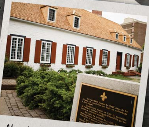
Manoir Boucher de-Miverville