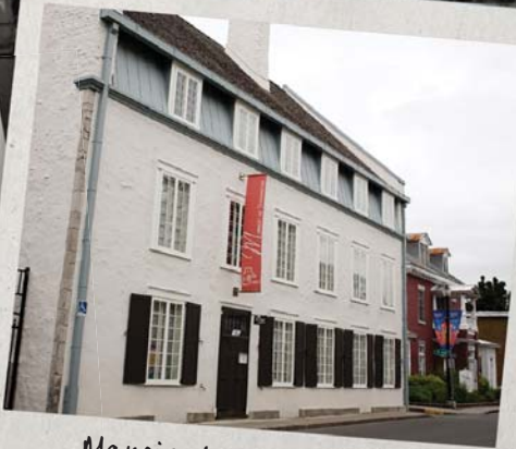
Manoir de Tonnancour, Galerie d'art du Parc