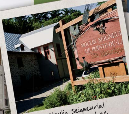
Moulin Seigneurial de Pointe-du-Lac