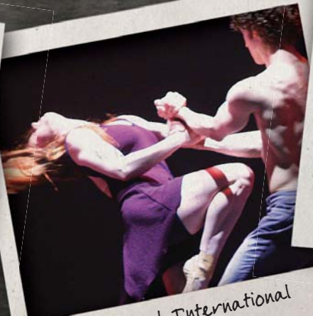
Festival International Danse Encore