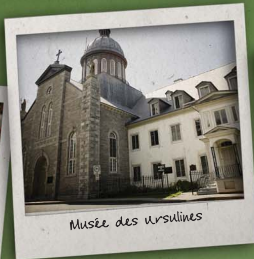
Musée des ursulines