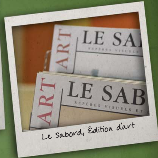
Le Sabord, Édition d'art