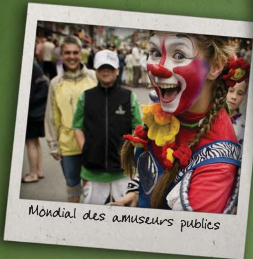
Mondial des amuseurs publics